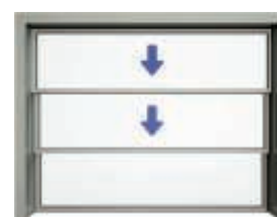
Tredelad nedåtgående skjutlucka