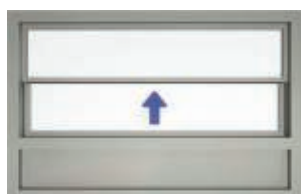
Tvådelad skjutlucka med fast aluminiumparti under