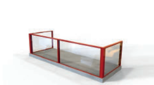
Enkelt glasräcke med räckeprofil.