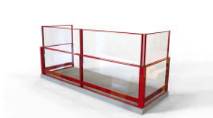
Standard höj- och sänkbar inglasning.