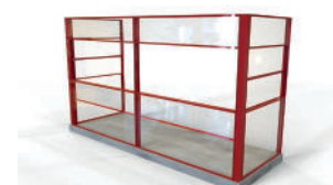
SPLITT - helinglasning