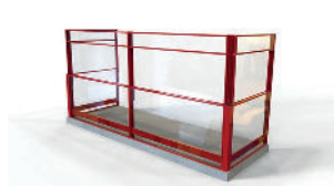
Höj- och sänkbar inglasning med fast överljus.