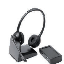
Headset 111-08116 Duo