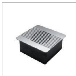
Infälld mikrofon Silver (120 x 120 x 65 mm) 111-08132