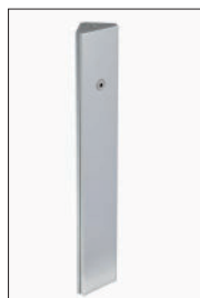
Mikrofon trekantstlist Fritt stående på disk eller fast mont. på vägg (37 x 250 mm) 111-08044