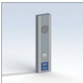
Porttelefon med mikrofon, högtalare och anropsknapp. (50 x 200 x 20 mm) 111-08123