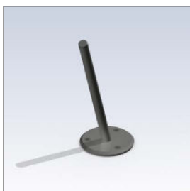
Stavmikrofon RF Med lysande indikationsring. Ø 70 mm 111-08134