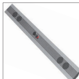
Trekantslist med mikrofon, högtalare och anropsknapp. (500 x 61 x 42 mm) 111-08122

111-08103 Signalförstärkare inkl. adapter och 10 m kabel. 111-08104-7 Förlängningskabel 3 m, 5 m, 10 m, 20 m.