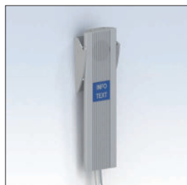
Telefonenhet med mikrofon och högtalare. (50 x 200 x 20 mm) 111-08125