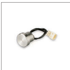
Kapselmikrofon Ø 12/9 mm 111-08130