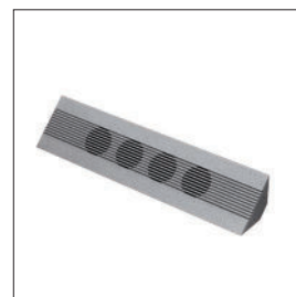
Högtalare trekantstlist Fritt stående på disk eller fast mont. på vägg (200 x 42 x 61 mm) 111-08143