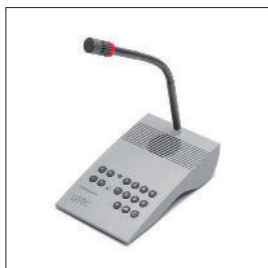
Bordsversion Silver (115 x 185 x 43 mm) 111-08110

Till centralenheten ansluts en manöverenhet med mikrofon, högtalare och manöverknappar för funktioner som t.ex. på/av, svar, dörröppnare, högtalarutrop med/utan signal, volymkontroll med LED-display, mute-knapp (stänger av innermikrofonen). Levereras med 1,5 m kabel.