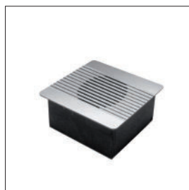
Infälld högtalare Silver eller svart (120 x 120 x 65 mm) 111-08142