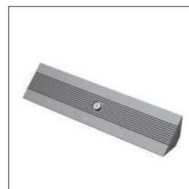
Mikrofon trekantstlist Fritt stående på disk eller fast mont. på vägg (200 x 42 x 61 mm) 111-08133