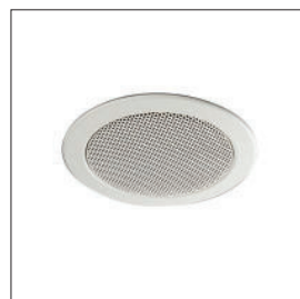
Takhögtalare Ø 105/92 mm För infällning. 111-08141