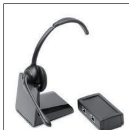
Headset 111-08115 Mono