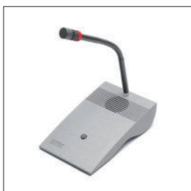
Bordsversion Silver (115 x 185 x 43 mm) 111-08120

Externa enheter finns i flera olika utföranden enligt nedan. Observera att samtliga externa enheter är kabelanslutna. Vid inkoppling av flera externa enheter behövs ev komplettering med adapter och/eller signalförstärkare.