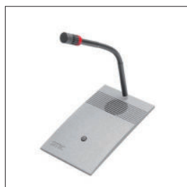
Infälld version Silver (128 x 188 x 34 mm) 111-08121