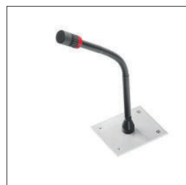
Svanhalsmikrofon Med lysande indikationsring Silver eller svart 111-08131