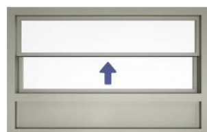
Tvådelad uppåtgående med fast aluminiumparti under