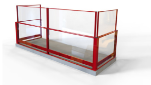
Standard höj- och sänkbart glasräcke.