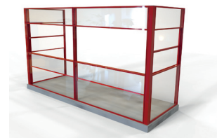
SPLITT - helinglasning