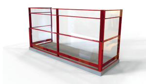
Höj- och sänkbart glasräcke med fast överljus.