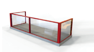
Enkelt glasräcke med räcketprofil.